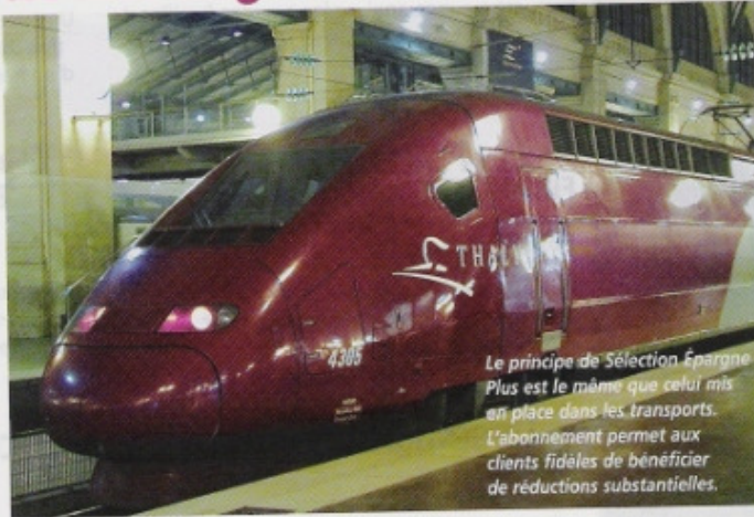
Le principe de Sélection Épargne Plus est le même que celui mis en place dans les transports. L'abonnement permet aux clients fidèles de bénéficier de réductions substantielles.

Stratégie Euro prestige, qui se définit comme un concepteur de produits pour les réseaux de distribution de produits financiers, lance le contrat d'assurance vie "Sélection Épargne Plus", géré par ACMN Vie, filiale assurée du Groupe Crédit Mutuel Nord Europe. Selon la société, ce contrat permet à ses distributeurs de « proposer des frais réduits directement concurrents des offres internet et un accompagnement à la fois dans la durée et personnalisé à leurs clients. » Pourquoi? Parce que tout est censé les fidéliser.