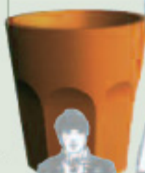
Cubalibre hauteur : 98 cm

A vec elle tout est permis, les formes les plus audacieuses de contenants et les couleurs les plus folles.