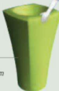
Tonqua hauteur : 100 cm

Le mobilier ne sera pas oublié, la résine roto moulée a désormais une place de choix dans notre extérieur, formes et couleurs délicates garanties !