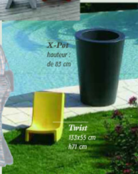
Twist 133x55 cm h71 cm